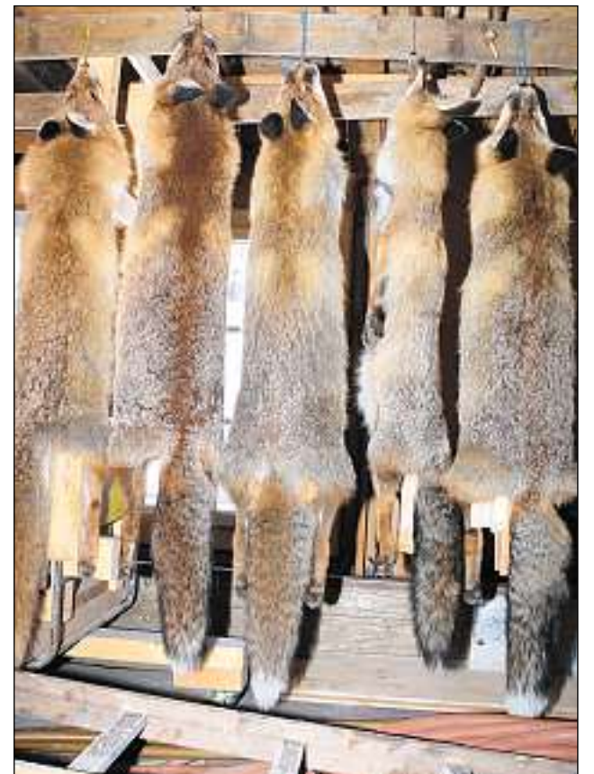
Entgins bials fols d'uolp dalla catscha da quest unviern.