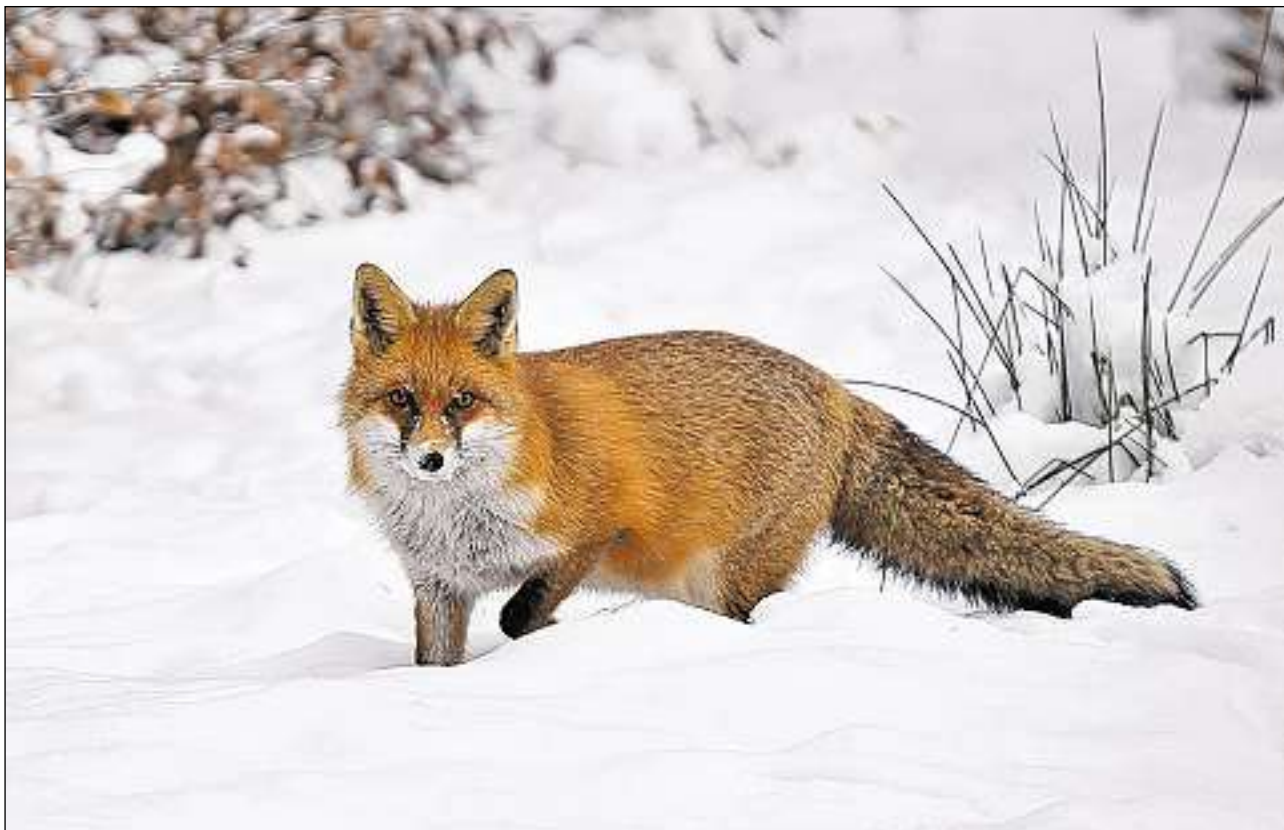
L'uolp ei en mira dil catschadur durant la catscha da laghetg che cuoza dil november entochen la fin da fevrer.